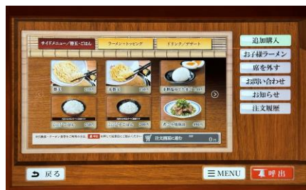
追加オーダー画面