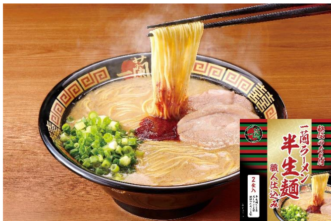
※ご提供商品イメージ