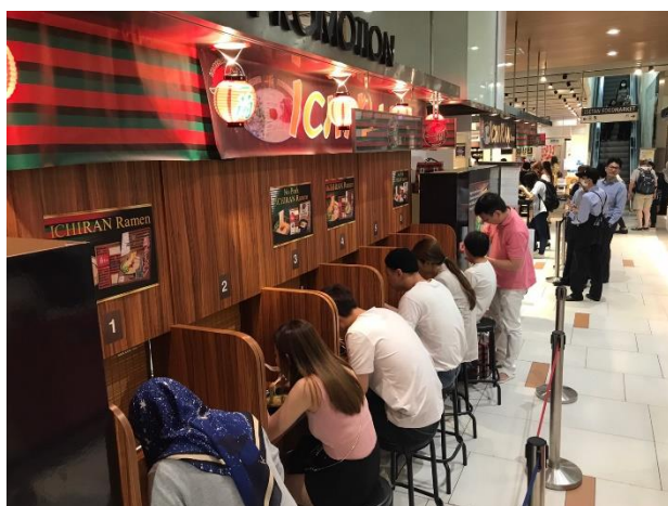
※マレーシアでの催事の様子（2020年3月）